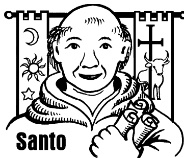
Santo Tomás de Aquino